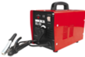
MAQUINA DE SOLDAR