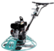
ALISADORA PULIDO DE PISOS