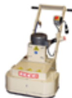
PULIDORAS DE CONCRETO