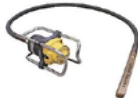
VIBRADORAS DE CONCRETO